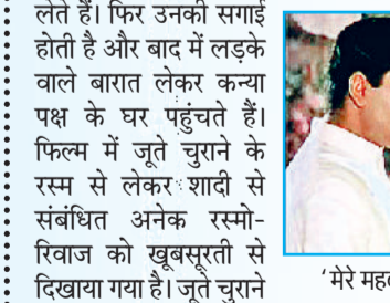
'मेरे महबूब' में राजेंद्र कुमार-साधना

भारतीय समाज में कश्मीर से कन्याकुमारी तक हर वंश और समाज में शादी समारोह का बहुत ही महत्वपूर्ण स्थान माना जाता है। शादी यही वजह है कि बॉलीवुड की कई फिल्मों की कहानियों के केंद्र में भी शादी समारोह को रखा गया है। चाहे वह परंपरागत अरेंज मैरिज हो, लव मैरिज हो, भागकर की गई शादी हो, अमीर-गरीब के बीच शादी हो, अंतर-जातीय या अंतर-धार्मिक विवाह हो या दो अलग-अलग संस्कृति या भाषा से संबंधित लोगों की शादी हो। वेडिंग एलबम जैसी 'हम आपके हैं कौन': साल 1994 में रिलीज फिल्म 'हम आपके हैं कौन' वेडिंग फंक्शन पर केंद्रित एक बेहतरीन फिल्म है। फिल्म के केंद्र में यूं तो प्रेम (सलमान खान) और निशा (माधुरी दीक्षित) की लव स्टोरी, अपने परिवार के लिए त्याग की भावना है। लेकिन यह वास्तव में अभिभावकों द्वारा तय किए गए परंपरागत हिंदू विवाह का प्रभावी ढंग से तैयार किए गए शादी के वीडियो एलबम की तरह है। फिल्म में दो दोस्त जब बहुत दिनों बाद मिलते हैं, तो आपस में अपने बच्चों की शादी कराने का निश्चय करते हैं और फिर एक परंपरागत विवाह का सिलसिला आरंभ हो जाता है। लड़के और लड़की की मुलाकात घर से बाहर अलग स्थान पर कराई जाती है। वे एक-दूसरे को पसंद कर लेते हैं। फिर उनकी सगाई होती है और बाद में लड़के वाले बारात लेकर कन्या पक्ष के घर पहुंचते हैं। फिल्म में जूते चुराने के रस्म से लेकर शादी से संबंधित अनेक रस्मों-रिवाज को खूबसूरती से दिखाया गया है। जूते चुराने की रस्म पर केंद्रित गाना 'जूते दे दो पैसे ले लो' फिल्माया गया है। इसके अलावा फिल्म में कई सिचुएशंस पर बेहतरीन गीत पिरोए गए हैं।