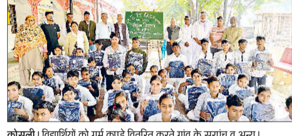
कोसली। विद्यार्थियों को गर्म कपड़े वितरित करते गांव के सरपंच व अन्य।