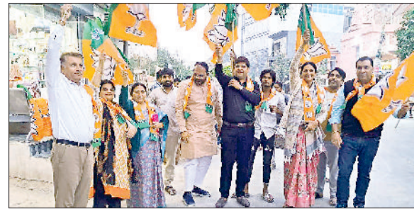
रेवाड़ी। बिहार में भाजपा की जीत पर खुशी मनाते हुए कार्यकर्ता।