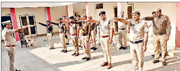
रेवाड़ी। राष्ट्र के प्रति समर्पण भाव की शपथ लेते हुए पुलिसकर्मियों।

हेमेंद्र कुमार मीणा शनिवार को पुलिस अधिकारियों और कर्मचारियों को राष्ट्र के प्रति समर्पण की शपथ दिलाने के बाद उन्हें संबोधित कर रहे थे। वन्दे मातरम् राष्ट्रिय गीत के 150 वर्ष का स्मरणोत्सव के अवसर पर पुलिस के सभी थाना व चौकी में देशभक्ति से जुड़े विभिन्न कार्यक्रम आयोजित किए गए।