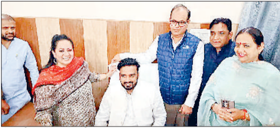
कोसली। कार्यक्रम में कैबिनेट मंत्री के साथ मौजूद अन्य नेता।