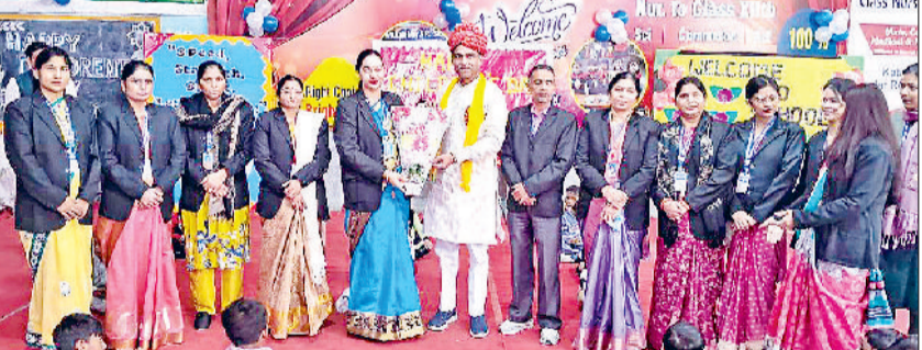
रेवाड़ी। कार्यक्रम वीफ गेस्ट का स्वागत करते हुए स्कूल स्टाफ।