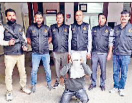
रेवाड़ी। विभिन्न मामलों में काबू किए गए आरोपी।