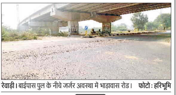
रेवाड़ी। बाईपास पुल के नीचे जर्जर अवस्था में भाइयास रोड।