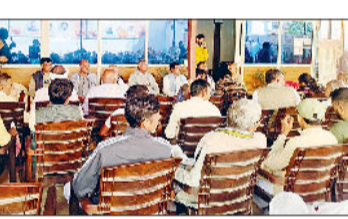
महेंद्रगढ़। कार्यकर्ताओं को दिशा-निर्देश देते विधायक।