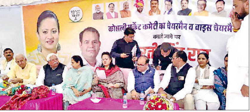
कोसली। किसान भवन में मौजूद स्वास्थ्य मंत्री आरती सिंह राव व अन्य।

दवा वितरण के कार्य को सुचारु किया गया हरिभूमि न्यूज, कोसली स्वास्थ्य मंत्री आरती सिंह राव ने कहा कि हरियाणा प्रदेश में चिकित्सा सुविधाओं का विस्तार व आम जनता के लिए सभी तरह की मेडिकल सेवाएं सुलभ करवाने के लिए सरकार गंभीरता से काम कर रही है। सरकारी अस्पतालों में 1100 नए डॉक्टरों की नियुक्ति की गई है। इसके अलावा दवा वितरण के कार्य को सुचारु किया गया है। किसान