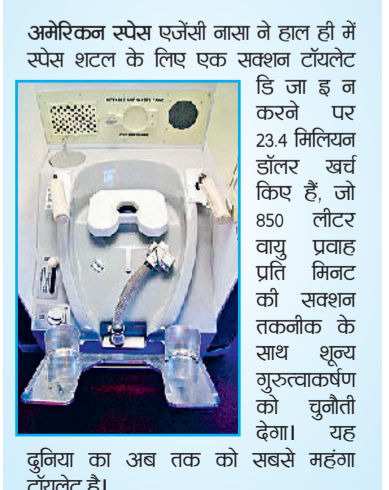
दुनिया का अब तक का सबसे महंगा टॉयलेट है।

पब्लिक टॉयलेट के इस्तेमाल में बरतें सावधानी: व्यापक सर्वे और अध्ययन के बेस पर विशेषज्ञों का मानना है कि अगर आप किसी सार्वजनिक शौचालय में सबसे साफ शौचालय का इस्तेमाल करना चाहते हैं, तो पब्लिक में सबसे पहले वाले शौचालय कक्ष (जो दरवाजे या सिंक के सबसे पास हो) का ही इस्तेमाल करें। यह आमतौर पर सबसे कम यूज किया जाता है और इसलिए तुलनात्मक रूप से अधिक साफ होता है। सबसे गंदा स्थान नहीं है टॉयलेट: आपको यह जानकर हैरानी होगी कि औसत रसोईघर के चॉपिंग बोर्ड पर शौचालय की सीट की तुलना में लगभग 200 प्रतिशत अधिक बैक्टीरिया होते हैं। इससे ज्यादा हैरान करने वाली बात यह है कि स्मार्टफोन में टॉयलेट हैंडल की तुलना में लगभग 20 गुना अधिक बैक्टीरिया होते हैं। एक औसत डेस्क पर एक औसत शौचालय सीट की तुलना में 400 गुना अधिक बैक्टीरिया होते हैं। *