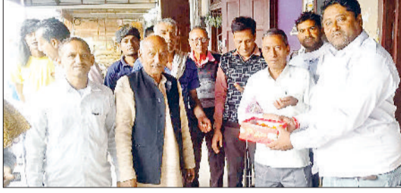
कनीना। मिठाई बांटकर सुखी जताते व्यापारी।